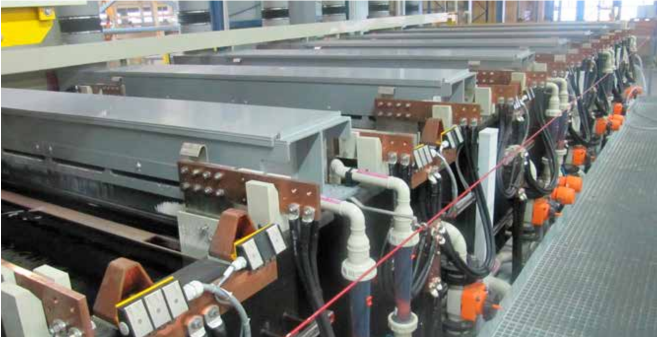
Abb. 6 Hartverchromen von Serienbauteilen in Gestellanlage mit Beschickungseinrichtung