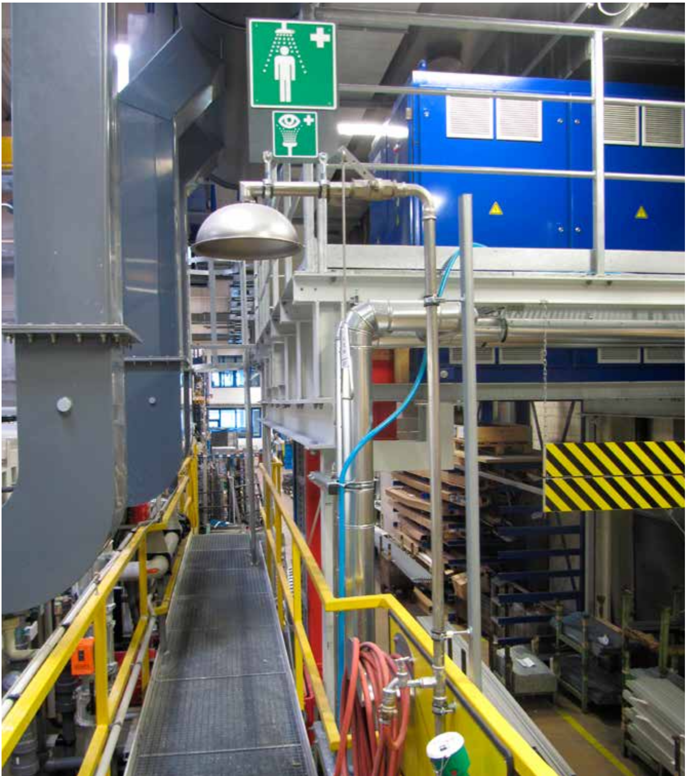
Abb. 19 Erste-Hilfe-Einrichtungen – Notdusche und Augendusche deutlich gekennzeichnet

In der Galvanik werden Tätigkeiten mit einer Vielzahl von Gefahrstoffen durchgeführt. Hierbei sind nachfolgende Anforderungen umzusetzen.