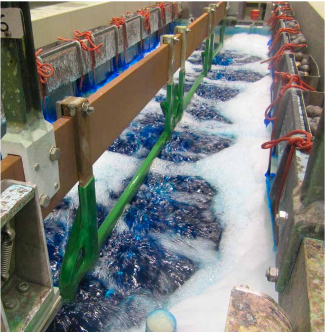
Abb. 11 Luftbewegter Elektrolyt zum sauren Verkupfern

Beim cyanidischen Verkupfern besteht eine inhalative chemische Gefährdung durch Cyanwasserstoff. Elektromagnetische Felder gefährden Personen mit aktiven Implantaten; nur beim sauren Verkupfern mit pulsierendem Gleichstrom alle Beschäftigten. Mechanische Gefährdungen sind an Beschickungseinrichtungen und an Trommelanlagen zu beachten. An Trommelanlagen existieren auch Gefährdungen durch Lärm, an den Behälterwandungen und Rohrleitungen thermische Gefährdungen durch heiße Oberflächen.