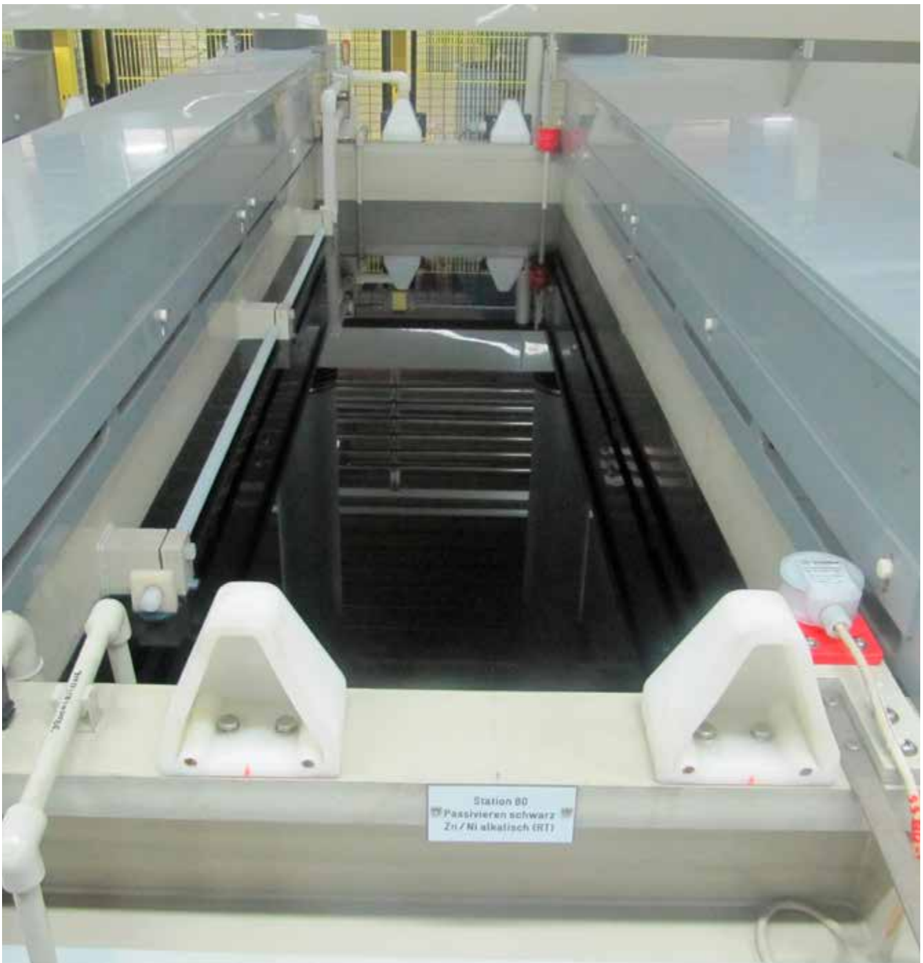
Abb. 17 Schwarz-Passivierung mit Chrom(III)-Elektrolyten

Beim Chromatieren bestehen inhalative und dermale Gefährdungen bei direktem Kontakt mit dem Chrom(VI)-Elektrolyten, z. B. bei manuell bedienten Prozessen oder handbedienten Krananlagen. Mechanische Gefährdungen bestehen durch Quetsch- und Scherstellen an automatisierten Anlagen durch kraftbetätigte Bewegungen der Beschickungseinrichtungen oder Warenträger bzw. Trommelanlagen.