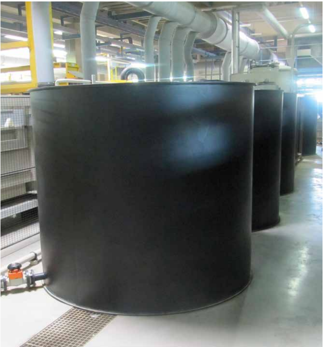
Abb. 22 Sammelbehälter mit Rückhalteeinrichtung in der Abwasserbehandlung

Der Betrieb einer galvanotechnischen Anlage schließt auch die Entsorgung verbrauchter Spülflüssigkeiten und Konzentrate mit ein. Dabei unterscheidet man zwischen interner Entsorgung über eine eigene Abwasserbehandlungsanlage und externer Entsorgung mittels Sammelbehälter und Abfuhr der Flüssigkeiten in Tankfahrzeugen oder Behältern (IBCs).