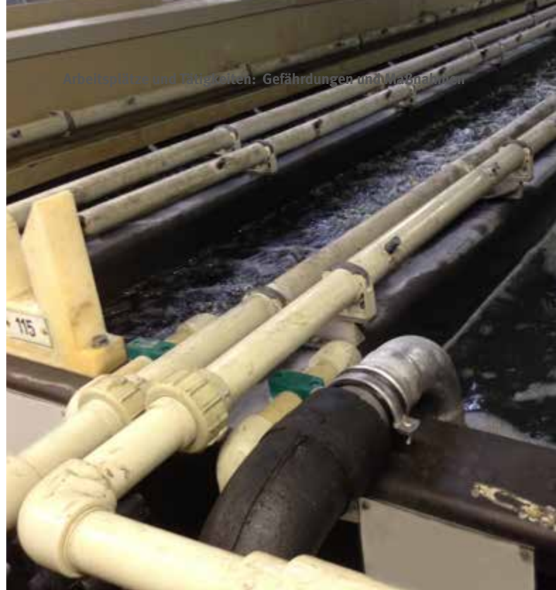
Abb. 15 Phosphatierung