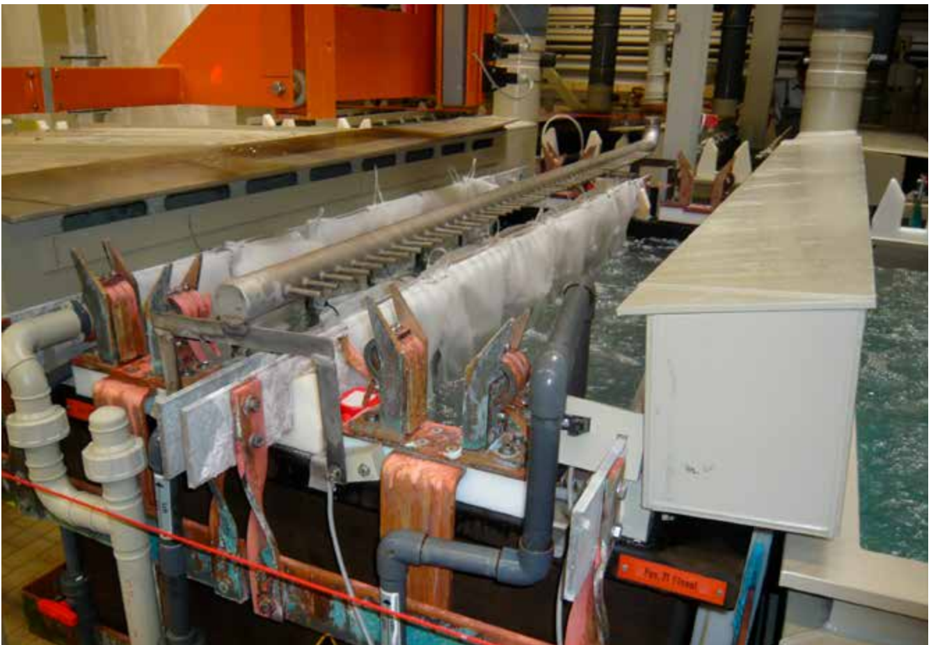
Abb. 16 Eloxieren mit Kathodenumhüllung und Push-Pull-System zur Erfassung der Schwefelsäure-Aerosole

Bei der anodischen Oxidation von Aluminium nach dem Schwefelsäureverfahren bestehen inhalative Gefährdungen durch Schwefelsäureaerosole. Hautgefährdungen existieren aufgrund von Kontaktmöglichkeiten zum Elektrolyten bei manuell bedienten Prozessen oder handbedienten Krananlagen. Thermische Gefährdungen bestehen durch heiße Oberflächen, Rohrleitungen und Medien an den Heißverdichtungen. Elektromagnetische Felder in der Nähe von Wechselrichtern oder Gleichrichtern gefährden Personen mit aktiven Implantaten.