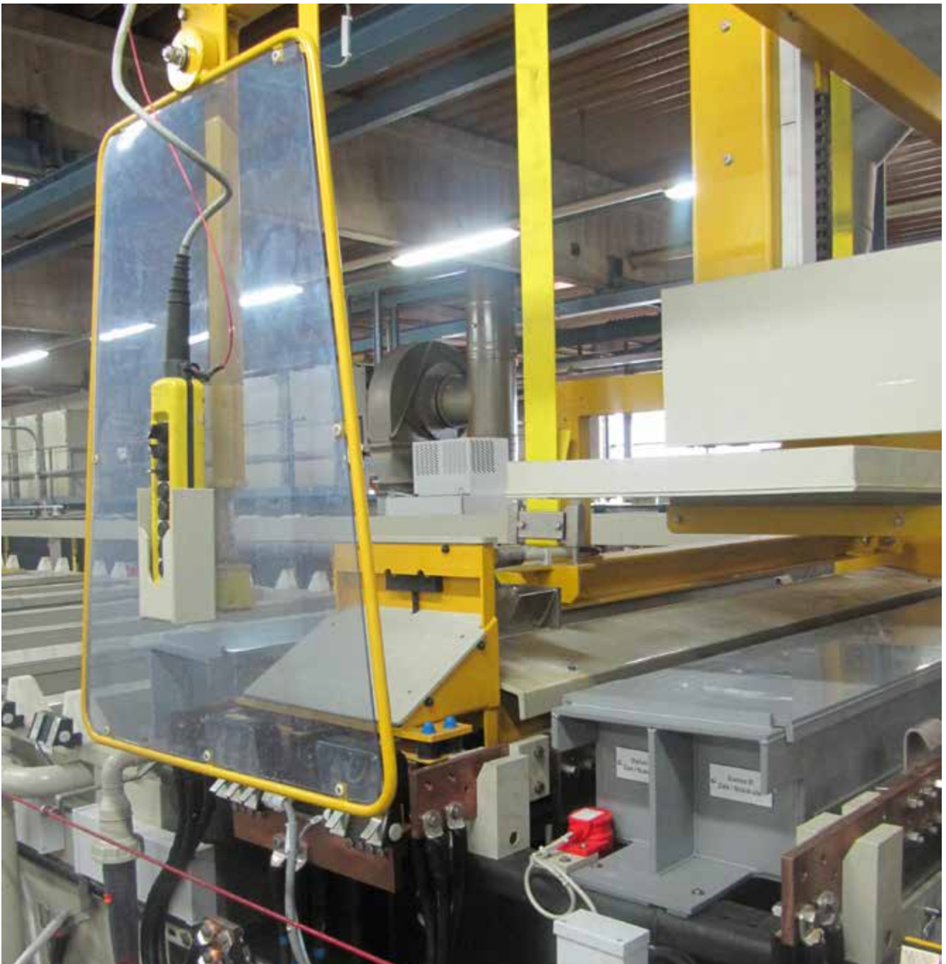
Abb. 8 Anlage zum Glanzverchromen mit Anfahrbügel am Transportwagen und Tropfschale

Chrom(VI)-Verbindungen beim Glanz-/Schwarzverchromen von Einzelbauteilen verursachen inhalative, dermale und orale chemische Gefährdungen. Eine wirksame Absaugung reduziert diese Gefährdungen ebenso wie die Brand- und Explosionsgefahr durch freiwerdenden Wasserstoff. Elektromagnetische Felder gefährden Personen mit aktiven Implantaten. Mechanische Gefährdungen sind an Beschickungseinrichtungen und Trommelanlagen zu beachten. An Trommelanlagen existieren auch Gefährdungen durch Lärm.