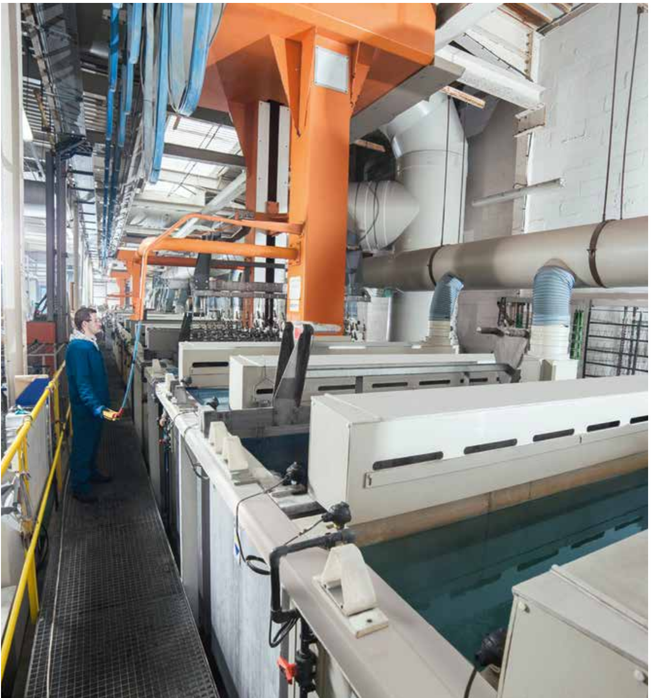
Abb. 4 Dekapierung an einer halbautomatischen Gestellanlage

Eingesetzte Säuren und Laugen beim Dekapieren verursachen besonders bei handbeschickten Prozessen inhalative und dermale chemische Gefährdungen. Eine wirksame Absaugung reduziert die inhalative Gefährdung. Mechanische Gefährdungen sind an Beschickungseinrichtungen und Trommelanlagen zu beachten. An Trommelanlagen existieren Gefährdungen durch Lärm.