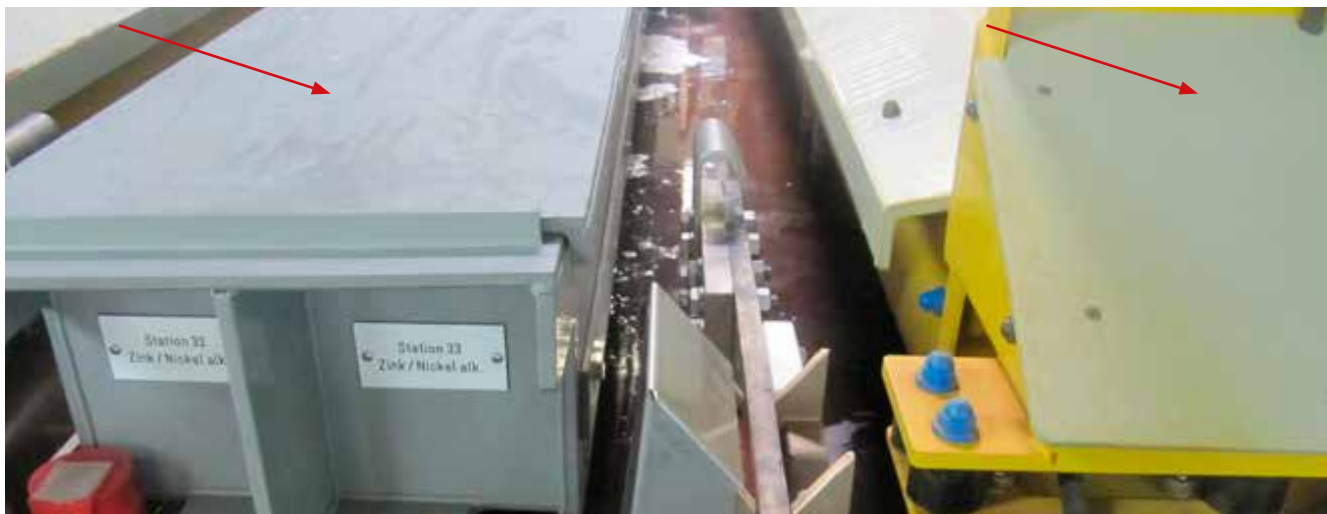
Abb. 12 Zink-Nickel-Elektrolyt mit eingehängter Trommel – Deckel zur Verbesserung der Absaugwirkung