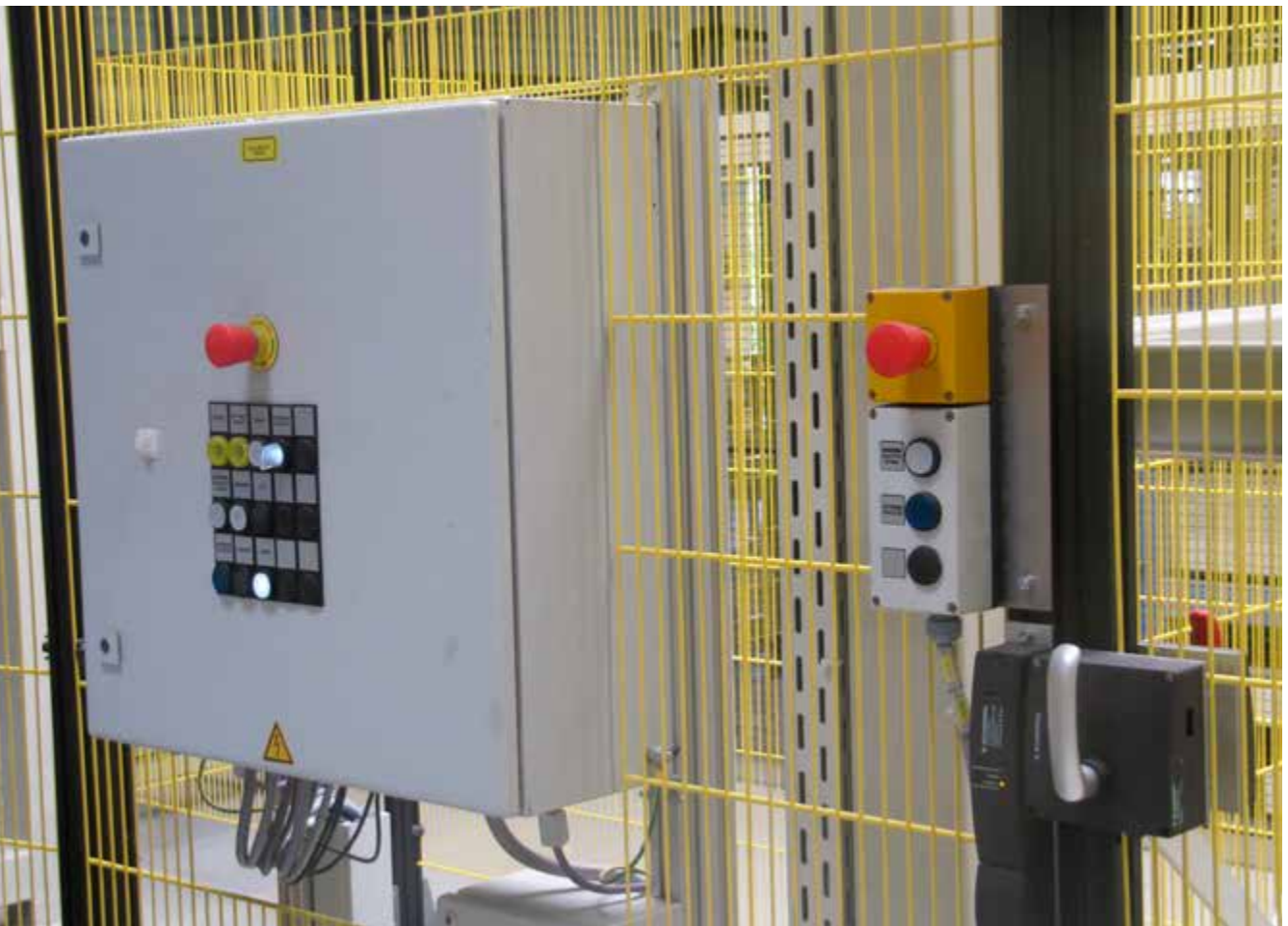
Abb. 21 Beseitigung von Störungen nur bei stillgesetzter Anlage – verriegelte Tür schützt vor ungesichertem Zugang

Störungen an Anlagen führen zu fehlbeschichteten Teilen oder zu Anlagenstillständen, z. B. durch abgestürzte Warenträger, Gestelle oder Bauteile. Dieser nicht bestimmungsgemäße Zustand kann zu Gefahren führen, die im Einzelfall betrachtet werden müssen. Überlegte Planung und Handlung zur Beseitigung der Störung ist wichtig, um Gefährdungen zu reduzieren.