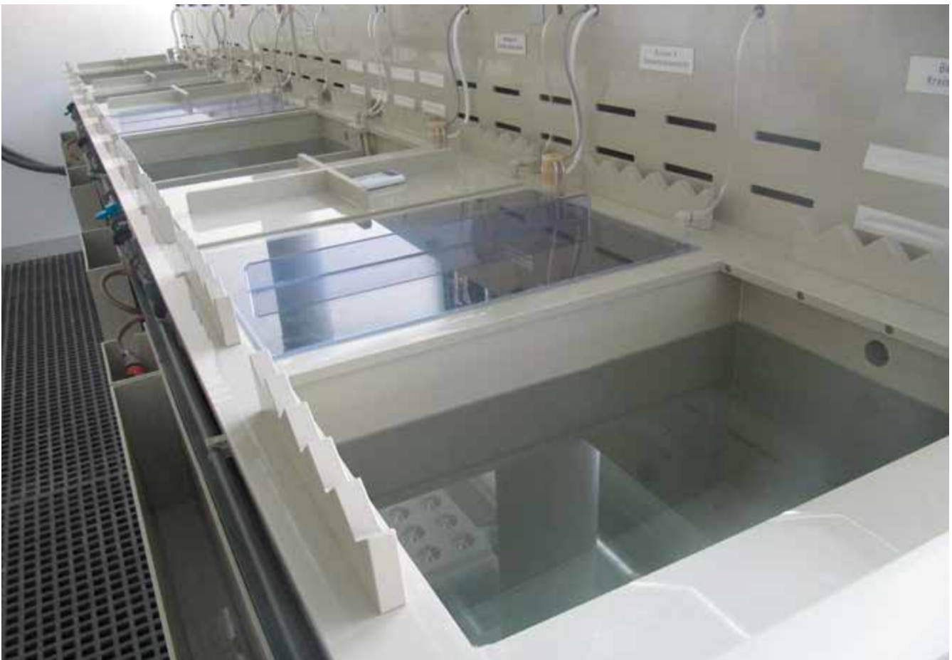
Abb. 13 Handbeschickte Anlage mit Wandabsaugung und Deckel zum Veredeln mit Gold und Silber

Bei der galvanischen Abscheidung von Gold- und Silberüberzügen aus cyanidischen Elektrolyten bestehen inhalative und dermale Gefährdungen durch die Bildung von giftigem Cyanwasserstoff. Warenträgerbewegungen an Beschickungseinrichtungen und Trommelanlagen verursachen mechanische Gefährdungen. An Bandanlagen bestehen Einzugsstellen, z. B. an Ab- und Aufwicklern. Elektromagnetische Felder in der Nähe von Wechselrichtern oder Gleichrichtern gefährden Personen mit aktiven Implantaten.