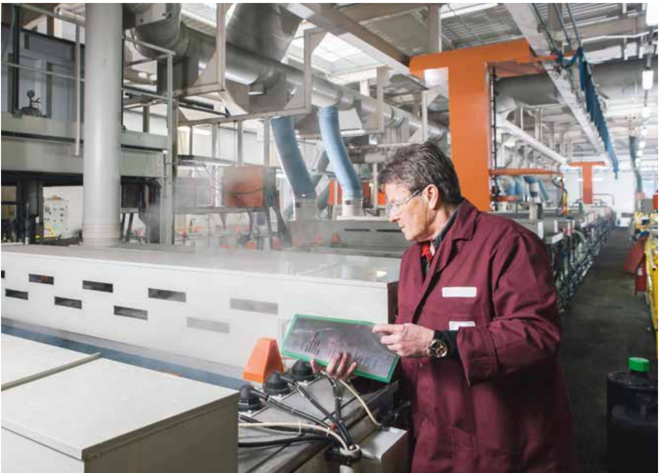
Abb. 23 Prüfung der Galvanikanlage durch eine befähigte Person

Zum sicheren Betrieb der Anlage und ihrer Komponenten sind erstmalige und wiederkehrende Prüfungen notwendig. Art und Umfang erforderlicher Prüfungen sowie die Fristen von wiederkehrenden Prüfungen sind im Rahmen der Gefährdungsbeurteilung zu ermitteln und festzulegen. Weiterhin ist festzulegen, welche Voraussetzungen das Prüfpersonal erfüllen muss (Qualifikation). Dabei sind entsprechende feste Vorgaben wie auch Hinweise der Herstellfirmen zu beachten.