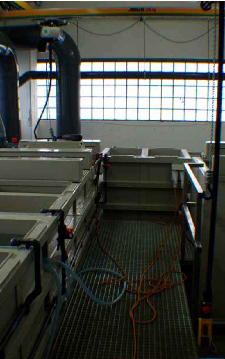
Abb. 10 Handbesockte Anlage zum chemischen Vernickeln - Stolpergefahr durch Schläuche vermeiden

Nickelhaltige Aerosole und Säuredämpfe beim chemischen Vernickeln von Einzelbauteilen verursachen inhalative und dermale chemische Gefährdungen, freier Wasserstoff führt zu Brand und Explosionsgefahr. Mechanische Gefährdungen sind an Beschickungseinrichtungen zu beachten. An den Behälterwänden und Rohrleitungen existieren große thermische Gefährdungen durch heiße Oberflächen.