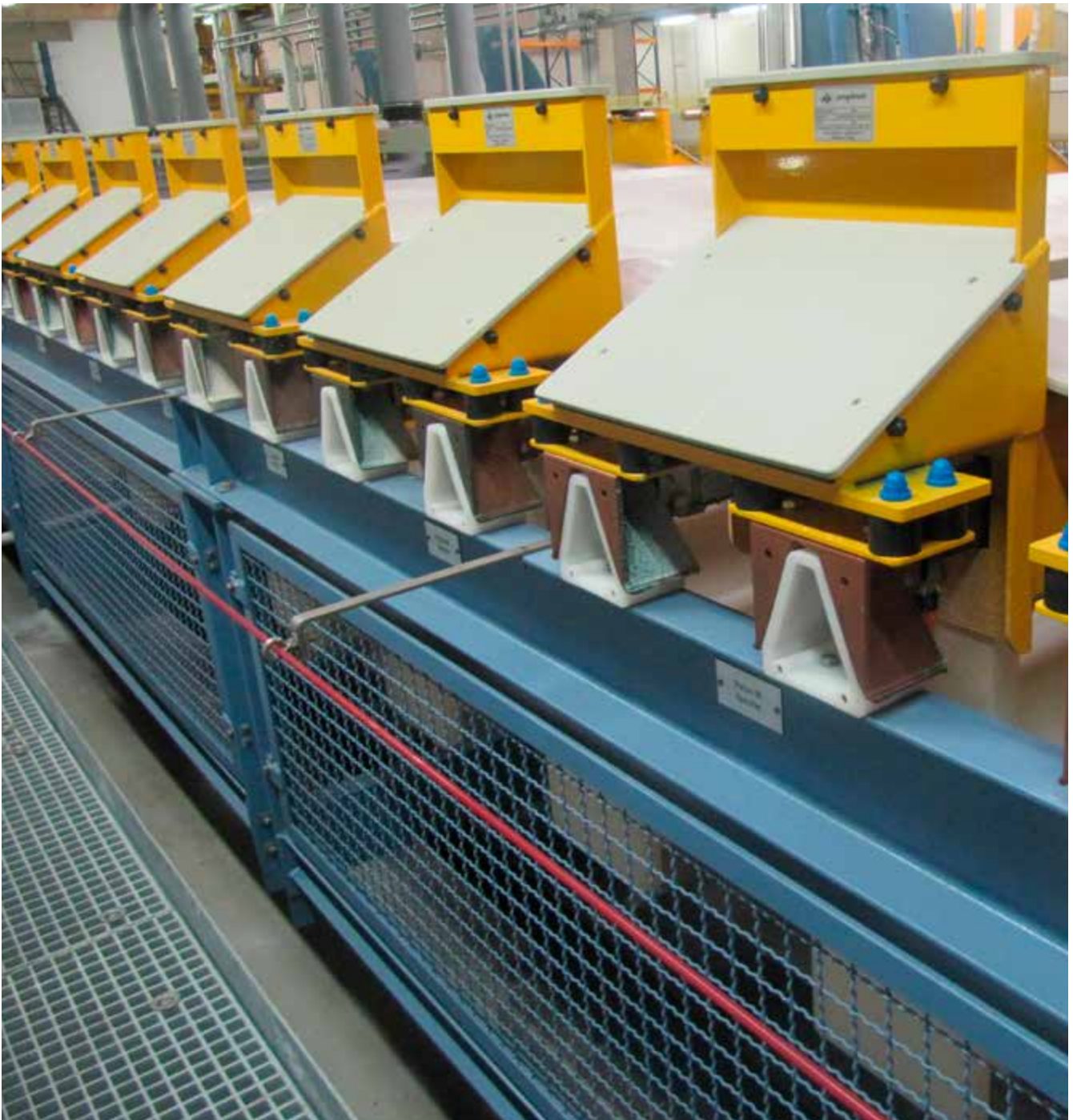
Abb. 14 Trommelanlage zum alkalischen Verzinnen mit Reißleine als Not-Halt-Einrichtung

Beim Verzinnen bestehen in der Hauptsache dermale Gefährdungen bei Kontaktmöglichkeiten zum Elektrolyten. An heißen Oberflächen und Rohrleitungen (alkalische Elektrolyte) bestehen thermische Gefährdungen. An Band- und Drahtverzinnungsanlagen treten mechanische Gefährdungen an Ein- und Auslaufstellen von Wickeleinrichtungen auf. Elektromagnetische Felder in der Nähe von Wechselrichtern oder Gleichrichtern gefährden Personen mit aktiven Implantaten.