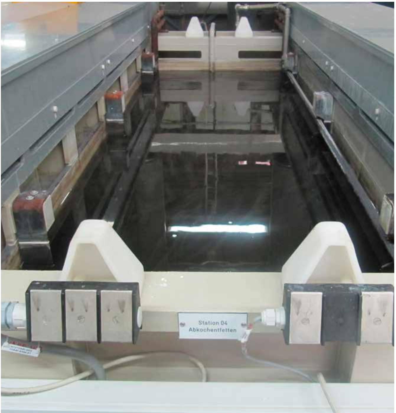
Abb. 2 Alkalische Entfettung mit beidseitiger Randabsaugung

Eingesetzte Laugen bei der alkalischen Entfettung verursachen besonders bei handbeschickten Prozessen oder beim Ansetzen/Nachschärfen hohe inhalative und dermale chemische Gefährdungen. Eine wirksame Absaugung reduziert diese Gefährdungen. Mechanische Gefährdungen sind an Beschickungseinrichtungen und Trommelanlagen zu beachten. An Trommelanlagen existieren auch Gefährdungen durch Lärm.