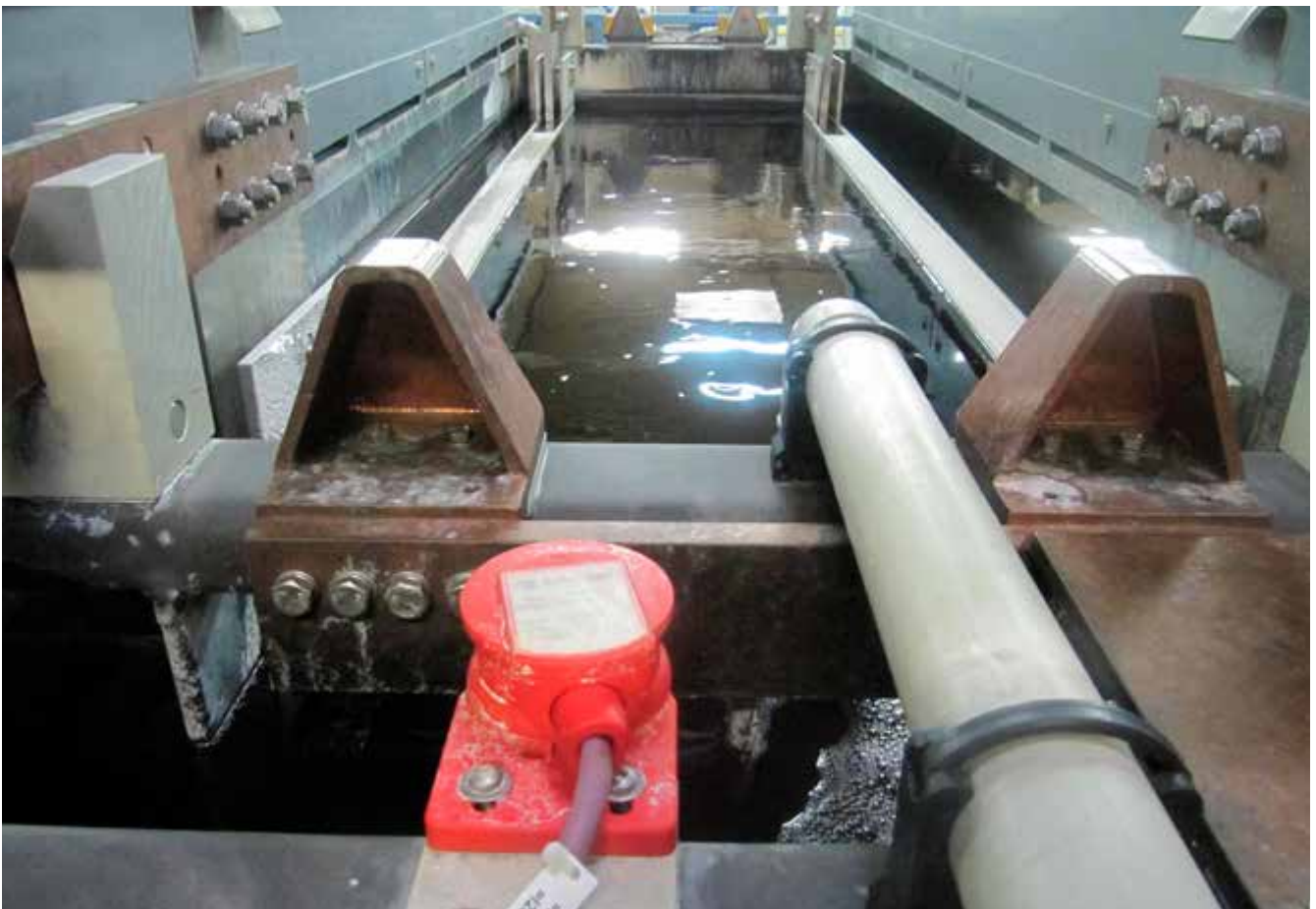
Abb. 3 Elektrolytische Entfettung mit beidseitiger Randabsaugung

Eingesetzte Laugen bei der elektrolytischen Entfettung verursachen besonders bei handbeschickten Prozessen hohe inhalative und dermale chemische Gefährdungen. Eine wirksame Absaugung reduziert diese Gefährdungen ebenso wie die Brand- und Explosionsgefahr durch den freiwerdenden Wasserstoff oder Sauerstoff. Elektromagnetische Felder gefährden nur Personen mit aktiven Implantaten.