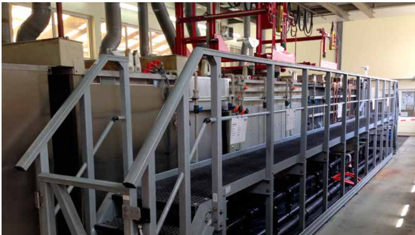
Abb. 1 Anlage zum Elektropolieren mit Absturzsicherung am Bediengang