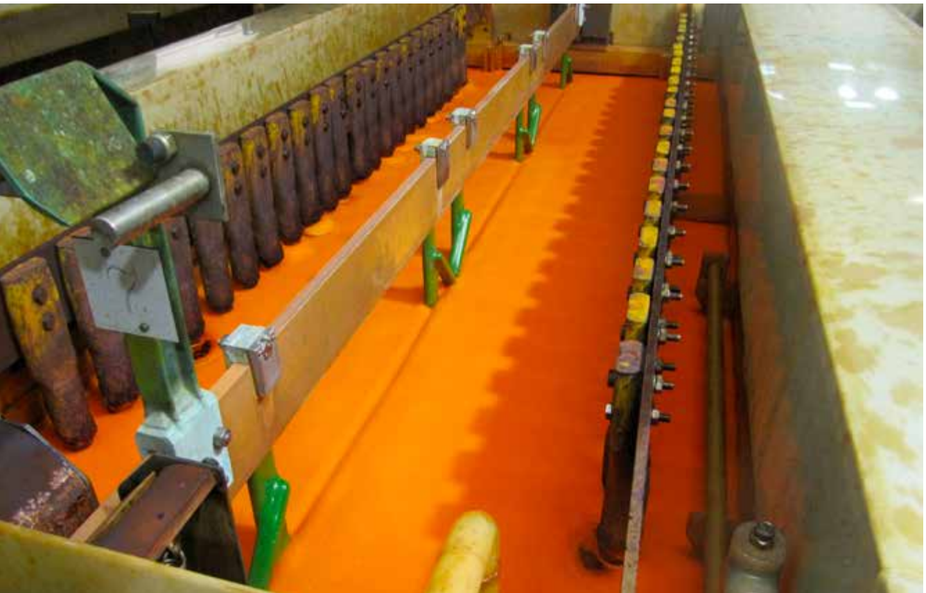
Abb. 7 Hartverchromen mit Netzmittel auf dem Elektrolyten

Chrom(VI)-Verbindungen beim Hartverchromen von Einzelbauteilen verursachen hohe inhalative, dermale und orale chemische Gefährdungen. Eine wirksame Absaugung reduziert diese Gefährdungen ebenso wie die Brand- und Explosionsgefahr durch den freiwerdenden Wasserstoff. Elektromagnetische Felder gefährden nicht nur Personen mit aktiven Implantaten. Mechanische Gefährdungen sind an Beschickungseinrichtungen zu beachten.