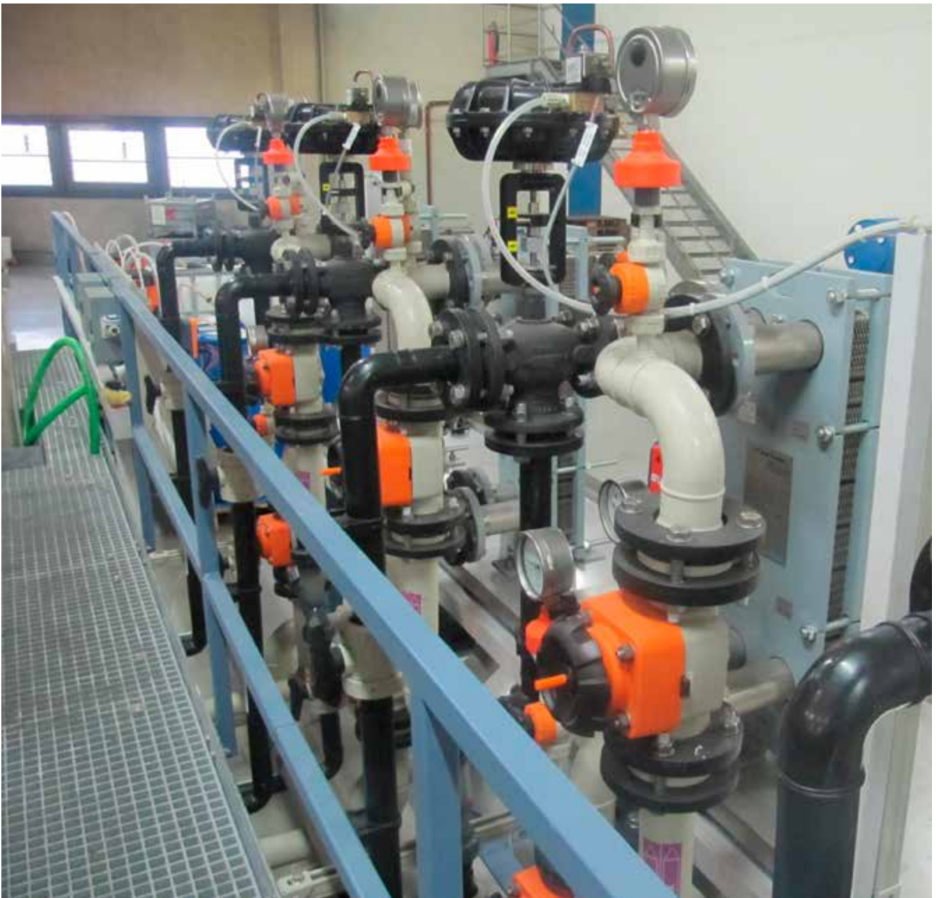
Abb. 20 Bühne zur sicheren Wartung und Instandhaltung von Nebenaggregaten

Um einen produktions sicheren Betrieb der Anlagen zu gewährleisten, müssen sie instandgehalten werden. Neben dem Tausch von Elektrolyten ist die Reinigung der Anlage und Komponenten eine wichtige Aufgabe; diese erfolgt im Stillstand der Anlage. Weiterhin ist für den korrekten Betrieb galvanotechnischer Anlagen oftmals eine Vielzahl von Nebenanlagen notwendig. Die Wartung dieser Nebenanlagen erfolgt dabei teilweise auch während des Betriebs der Anlagen (redundante Einrichtungen wechselseitig, z. B. Wechselschaltungen bei der Wasseraufbereitung) oder während Stillstandzeiten. Da diese Anlagen oft steuerungstechnisch mit der Anlage verbunden sind, bestehen Gefahren durch unkontrollierten Anlauf.