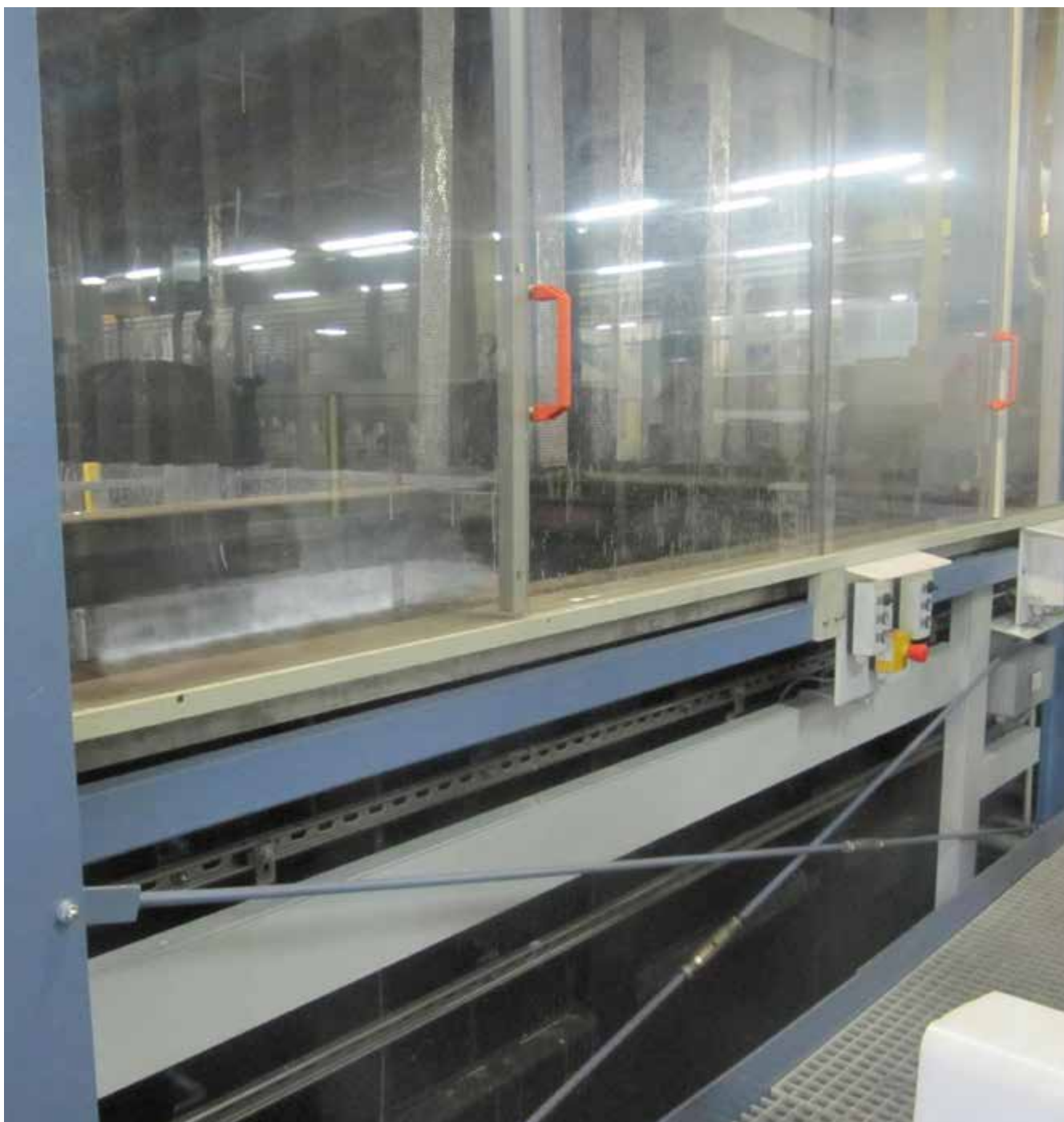
Abb. 18 Eingehauste Anlage zum Entmetallisieren

Je nach eingesetztem Gefahrstoff, Verfahren, chemischer oder galvanischer Entmetallisierung bestehen unterschiedliche inhalative und dermale Gefährdungen. Nachteilig ist die Entwicklung von gefährlichen Gasen und Dämpfen, zum Beispiel giftige Nitrose Gase beim Einsatz von Salpetersäure. Bei den überwiegend manuell bedienten Prozessen besteht eine besondere Kontaktmöglichkeit zu ätzenden Entmetallisierlösungen.