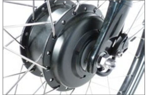
Abb. 4 Nabenmotor im Vorderrad

Der Motor befindet sich in der Nabe des Vorderrades. Die Kombination mit jeder Schaltung und Rücktrittbremse ist möglich. Nachteilig kann mangelnde Traktion (Griffigkeit) speziell beim Anfahren am Berg und in Kurven, auf rutschigem Untergrund sowie bei heckseitigem Schwerpunkt sein.