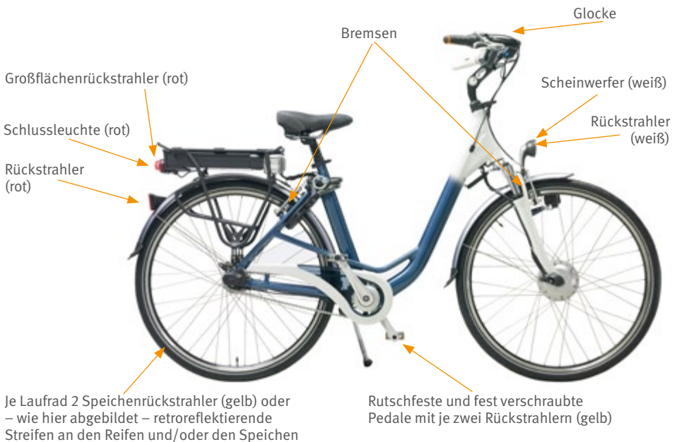
Abb. 7 Vorgeschriebene Ausrüstung des Pedelec 25

Pedelecs 25 müssen mit einem Scheinwerfer und mit einer Schlussleuchte ausgestattet sein. Sie können mit Strom aus einer