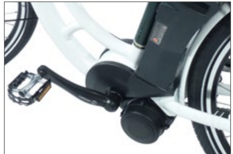
Abb. 5 Mittelmotor

Der Motor befindet sich im Bereich des Tretlagers. Die Lage des Schwerpunktes in der Mitte des Pedelec 25 ist für das Fahrverhalten im Vergleich zu den anderen Motoranordnungen von Vorteil.