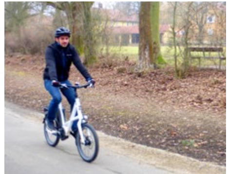
Abb. 16 Auf dem Weg zur Arbeit