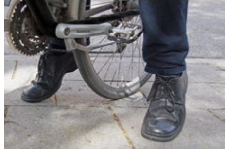
Abb. 13 Richtig eingestellte Sitzhöhe im Stand

Um eine angenehme, sichere und kraft-effiziente Sitzposition auf dem Pedelec 25 einnehmen zu können, ist die größtmögliche Anpassung des Pedelecs 25 an die jeweiligen individuellen Körpermaße des Benutzers erforderlich. Die benutzerabhängig erforderlichen Grundeinstellungen sollten vor Fahrtbeginn geprüft und gegebenenfalls angepasst werden. Dies wird durch die richtige Einstellung von Sattel und Lenker erreicht.