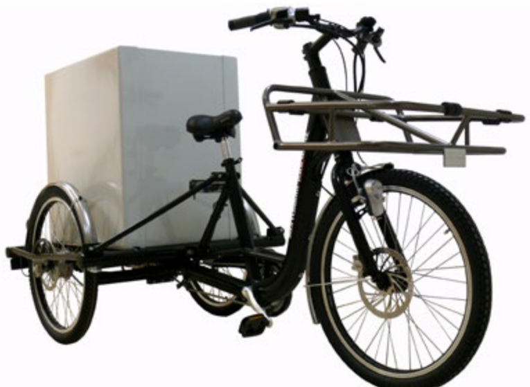
Abb. 3 Mehrspuriges Pedelec 25