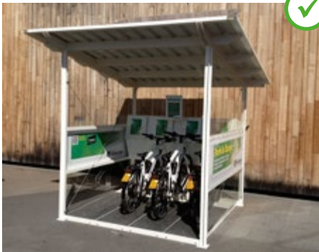
Abb. 17 Öffentliche Ladestation an einem Einkaufszentrum