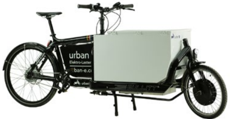
Abb. 2 Einspuriges Pedelec 25