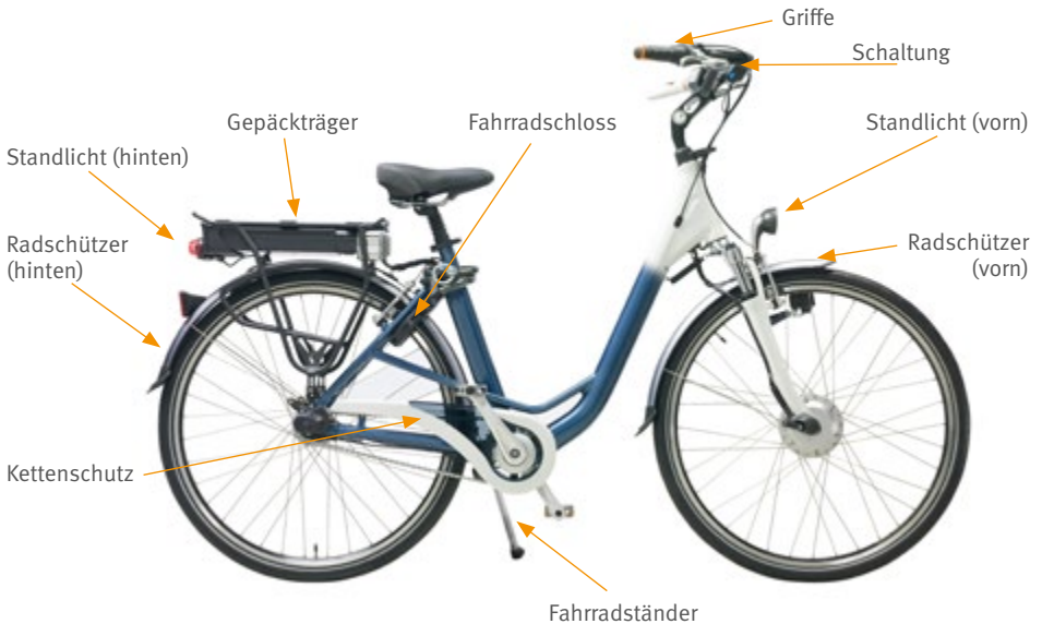
Abb. 9 Empfehlenswerte Zusatzausstattung des Pedelec 25