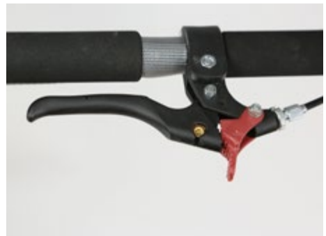
Abb. 12 Feststellbremse