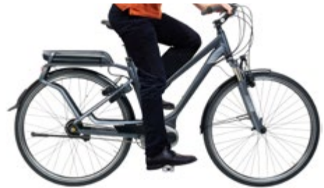
Abb. 14 Richtig eingestellte Sitzhöhe beim Tretvorgang

Die Einstellung der richtigen Sitzhöhe resultiert aus der Verstellung der jeweiligen Sattelhöhe. Die Sattelhöhe ist richtig eingestellt, wenn Sie – auf dem Sattel sitzend – mit den Fußballen beider Füße den Boden soeben erreichen können. Beim Tretvorgang selbst sollte das Bein im Kniegelenk nahezu vollständig gestreckt werden können. Die Sattelstütze darf maximal bis zu der jeweiligen umlaufenden Markierung herausgezogen werden. Hierbei ist die Mindesteinstecktiefe der Sattelstütze konsequent einzuhalten.