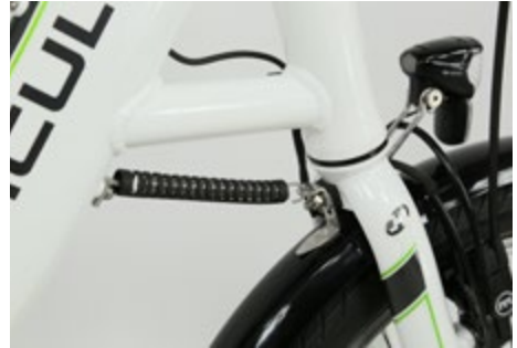
Abb. 10 Lenkungsdämpfer

Wird ein Pedelec 25 auf einem Zweibeinständer abgestellt, hat in der Regel das Vorderrad keinen Kontakt zum Boden und schwebt frei. Ein Lenkungsdämpfer stabilisiert die Vordergabel in Fahrtrichtung beim Abstellen und verhindert damit ein unkontrolliertes Verdrehen des Lenkers. Somit wird das Beschädigen von z. B. elektrischen Leitungen und Bowdenzügen vermieden.