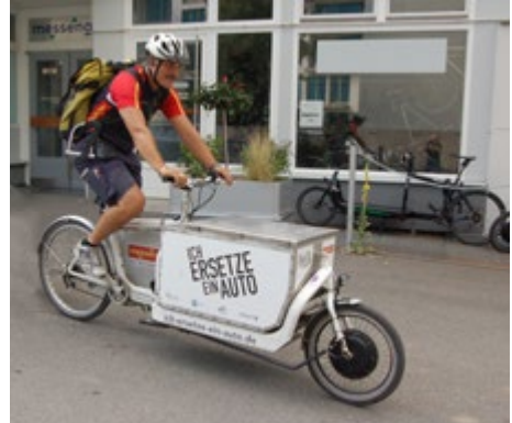
Abb. 15 Bei der Zustellung