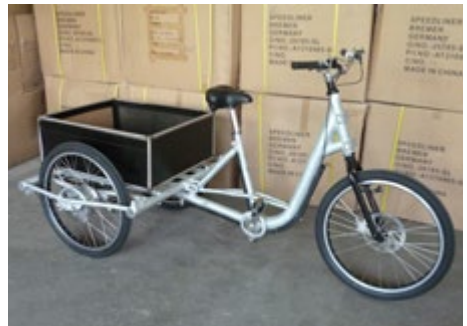
Abb. 1 Einsatz – und Nutzungsmöglichkeiten des Pedelecs 25