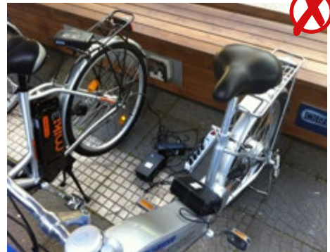
Abb. 18 Nicht empfehlenswert; Ladegeräte liegen auf dem Boden und sind über eine Mehrfachsteckdose unterverteilt (marktübliche Ladegeräte sind nur für die Benutzung in „trocknen Räumen“ geeignet)