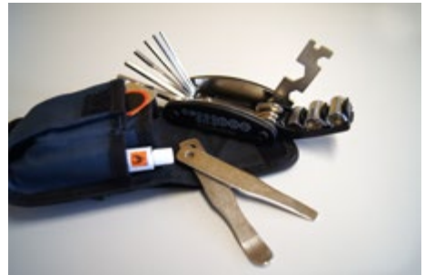
Abb. 11 Schrauben- und Inbusschlüsselset