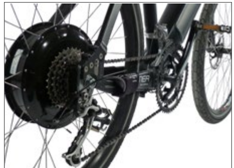
Abb. 6 Nabenmotor im Hinterrad

Der Motor befindet sich in der Nabe des Hinterrades. Diese Antriebsart bietet Traktionsvorteile am Berg. Bei hecklastiger Beladung neigt das Pedelec 25 zum „Flattern“.