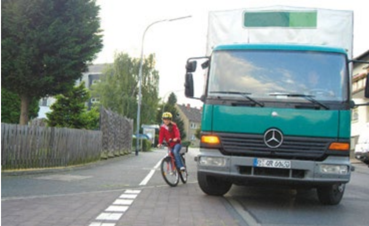
Abb. 16 Gefahr durch „Toten Winkel“