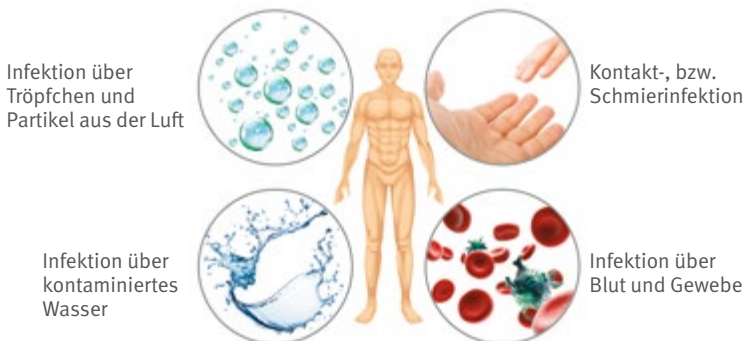
Abb. 1 Erregerübertragung auf den Menschen

Wenn Wäsche aus Krankenhäusern, pädiatrischen Kliniken bzw. Abteilungen, Heimen für Menschen mit Behinderung, Kinderkrippen oder Altenpflegeheimen angeliefert wird, kann das Wäschereipersonal in Kontakt mit durch Ausscheidungen verunreinigten Wäschestücken kommen. Das Vorkommen von Hepatitis-A-Viren (Risikogruppe 2) ist in solchen z. B. mit Kot verschmutzten Wäschestücken nicht auszuschließen. Somit ist das Risiko einer Hepatitis-A-Infektion in Form einer infektiösen Leberentzündung gegeben.