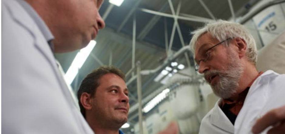
Abb. 2 Die Gefährdungsbeurteilung ist Basis zur Ableitung der Schutzmaßnahmen

Die Gefährdungsbeurteilung muss fachkundig durchgeführt werden. Verfügt die Arbeitgeberin bzw. der Arbeitgeber nicht selbst über die erforderlichen Kenntnisse, hat er sich fachkundig beraten zu lassen. Anforderungen an die Fachkunde werden in der TRBA 200 „Anforderungen an die Fachkunde nach Biostoffverordnung“ präzisiert [6].