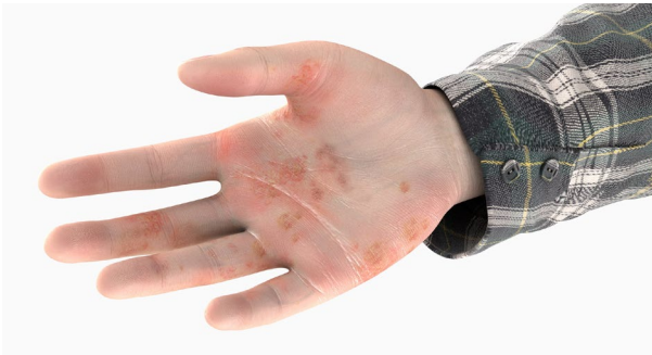
Abb. 1 Nicht mehr harmlos: Abnutzungsekzem (in den Finger- zwischenräumen)

Normale Haut ist glatt und geschmeidig, matt glänzend, rosig, feinporig, widerstandsfähig und wenig empfindlich. Bereits die trockene Haut, die leicht mit Rötung reagiert, sich schuppt, spannt, juckt oder zur Entzündung neigt, gehört zu den Veränderungen, die es zu beachten gilt, da sie Anzeichen eines beginnenden Handekzems sein können. Zunehmende Rötung, Schwellung, Bläschenbildung (insbesondere in den Fingerzwischenräumen), Nässen der Haut, Einrisse und Schmerzen sind Zeichen eines schweren Handekzems.