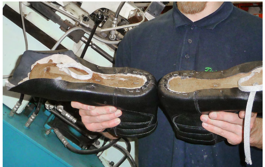
Die Herstellung orthopädischer Sicherheitsschuhe erfordert hohe Qualitätsstandards. Hier prüft der Orthopädienschuhmacher den korrekten Sitz des Schaftes auf dem Leisten.

Die Zuständigkeit ist an die nachstehend wiedergegebene Reihenfolge gebunden. Von den anfallenden Gesamtkosten lassen sich die Kostenträger in der Regel den Betrag erstatten, den der Arbeitgeber für Fußschutz ohne orthopädische Ausstattung aufgewendet hätte. Vor einer Auftragsvergabe muss eine Zusage des Kostenträgers vorliegen.