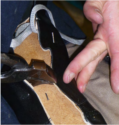
Ein Schuh wird von Hand gezwickt.

Im Anhang auf Seite 5 wird die Zuständigkeit näher erläutert. Dort werden alle 6 Kostenträger mit ihren Voraussetzungen für die Kostenübernahme, einschließlich der zugehörigen Rechtsgrundlage, aufgeführt. Im Einzelnen sind dies: