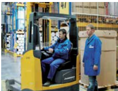
Nie an unübersichtlichen Stellen plötzlich die Fahrbahn betreten.