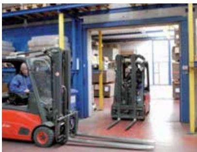
Besonders an Kreuzungspunkten ist Aufmerksamkeit gefragt.

Zahlreiche Unfälle entstehen durch das plötzliche Hineintreten in den Fahrweg des Staplers an unübersichtlichen Stellen.